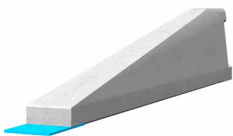
Anfangs-, Endelement REBLOC 60_3T (Steigung 1:5)