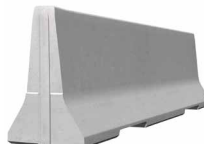
SIMPLEBLOC 100_4 Standardelement