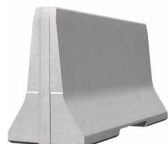
SIMPLEBLOC 100_2 Standardelement