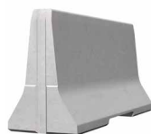
SIMPLEBLOC 100_2 Standardelement