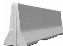
SIMPLEBLOC 100_4 Standardelement