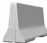
SIMPLEBLOC 100_4 Standardelement