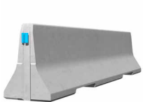
ECOBLOC 80_4 Standardelement