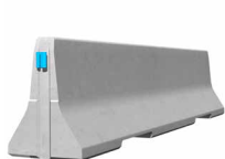
ECOBLOC 80_4 Standardelement