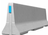
ECOBLOC 100_4 Standardelement