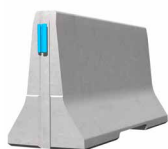
ECOBLOC 100_2 Standardelement