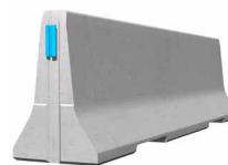
ECOBLOC 100_4 Standardelement