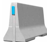
ECOBLOC 100_4 Standardelement